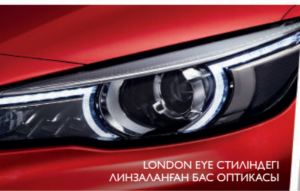
LONDON EYE СТИЛІНДЕГІ ЛИНЗАЛАНҒАН БАС ОПТИКАСЫ