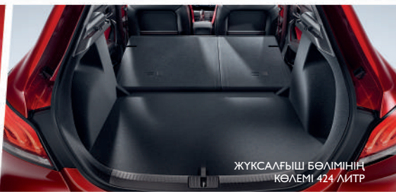
ЖҮКСАЛҒЫШ БӨЛІМІНІҢ КӨЛЕМІ 424 ЛИТР