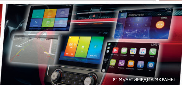
8" МУЛЬТИМЕДИА ЭКРАНЫ