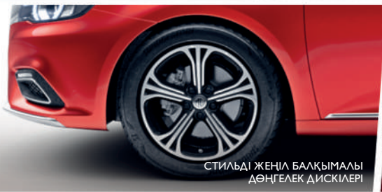
СТИЛЬДІ ЖЕҢІЛ БАЛҚЫМАЛЫ ДӨҢГЕЛЕК ДИСКІЛЕРІ