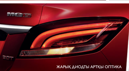
ЖАРЫҚ ДИОДТЫ АРТҚЫ ОПТИКА